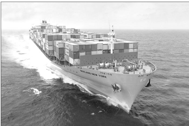
FTA 체결로 해외시장 개척