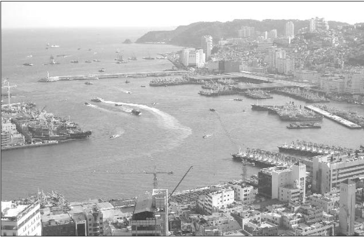
우리의 수출기지인 부산항만

- 서면으로 정보제공요청을 받은 수출업자나 생산자는 이를 수령한 날부터 30일 이내 답변하여야 하며, 그러하지 않을 경우 특혜관세대우를 받지 못할 수 있다.