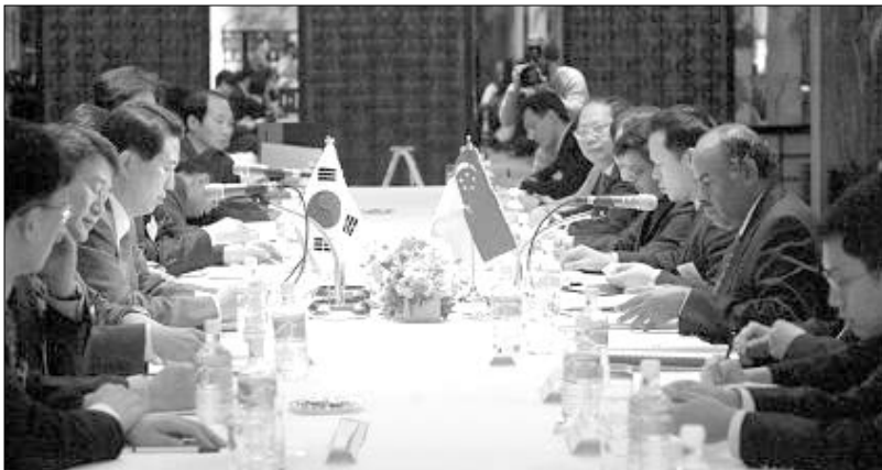
FTA 체결을 위한 양국간 협상